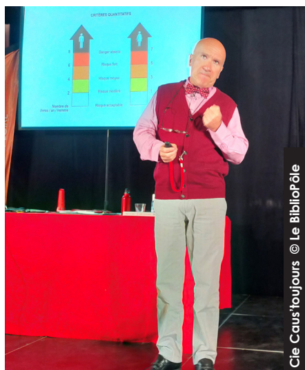
Cie Caus'toujours

Le 24 mai dernier, c'est avec un plaisir partagé que nous nous sommes retrouvés dans l'enceinte du Château du Plessis-Macé, pour la journée des bibliothécaires de Maine-et-Loire.