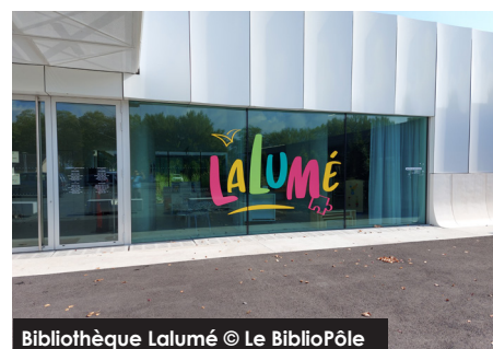
Bibliothèque Lalumé

* Esar est un acronyme qui définit 4 types de jeux : Exercice, Symbolique, Assemblage, Règles.