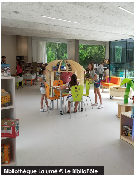
Bibliothèque Lalumé

Depuis le début de l'été, les Saint-Georgois bénéficient d'une nouvelle médiathèque, à l'architecture intérieure judicieusement pensée.