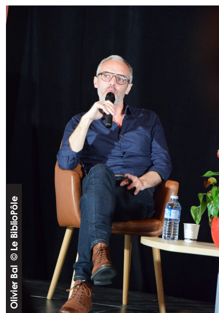
Olivier Bal © Le BiblioPôle