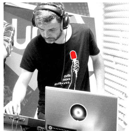
Studio 842 dispose d'instruments de musique, de casques, d'outils audio-numériques, d'un système de diffusion...

- « Musique et handicap » qui s'adresse à des enfants et adolescents en situation de handicap. Ils pourront mener un travail sur le son, le geste, la place du corps dans la musique ; le tout avec des instruments accessibles.