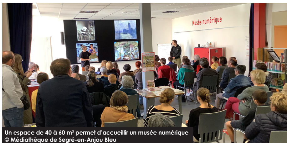
Un espace de 40 à 60 m 2 permet d'accueillir un musée numérique

À la médiathèque, la Micro-Folie met en scène le musée numérique en mode visiteur libre les mercredis après-midi et les samedis. Des temps de médiation sont organisés pendant les vacances scolaires ou autour d'événements communs au réseau de lecture publique comme par exemple lors des Nuits de la Lecture.