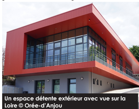
Un espace détente extérieur avec vue sur la Loire © Orée-d'Anjou

D'une surface totale de 400 m 2 , cette nouvelle structure culturelle conçue par le cabinet d'architectes MCM d'Angers s'ouvre sur 200 m 2 dédiés aux jeux et à la lecture et une salle d'activités de 40 m 2 . Les élus et les professionnels avaient à cœur de proposer un établissement moderne et lumineux où chacun, petits et grands, pourrait trouver sa place.