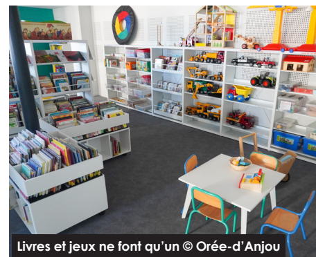
Livres et jeux ne font qu'un

Situés au sous-sol, les bureaux des deux professionnels côtoient un local polyvalent spacieux. Il accueille les collections du BiblioPôle qui alimentent la plateforme du réseau. Mis en place depuis deux ans, ce dépôt conséquent de livres dans lequel les bibliothèques du réseau viennent s'approvisionner, est beaucoup plus fonctionnel.