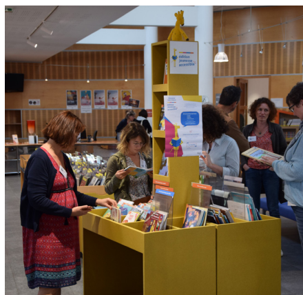
Des espaces dédiés, visibles qui interpellent l'usager et proposent des ressources variées pour tous