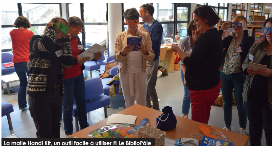
La malle Handi Kit, un outil facile à utiliser