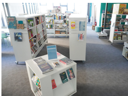
Des rayonnages qui sont mobiles grâce aux étagères à roulettes

Une équipe de quarante-quatre bénévoles, Anita Dommangeau, bibliothécaire et Matthieu Duclos, ludothécaire font vivre et animent ce lieu. Ils conseillent et accompagnent les usagers vers les espaces jeux,