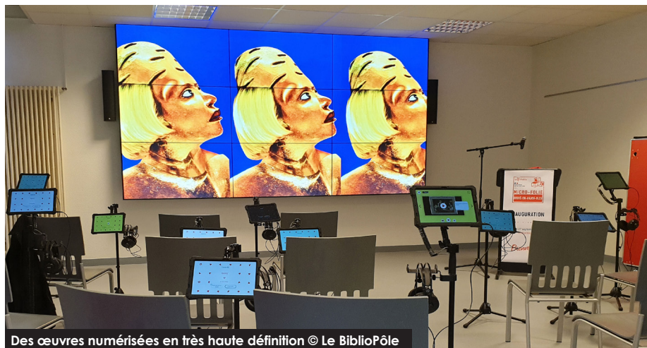
Des œuvres numérisées en très haute définition

C'était une volonté des élus que d'installer une Micro-Folie sur Segré-