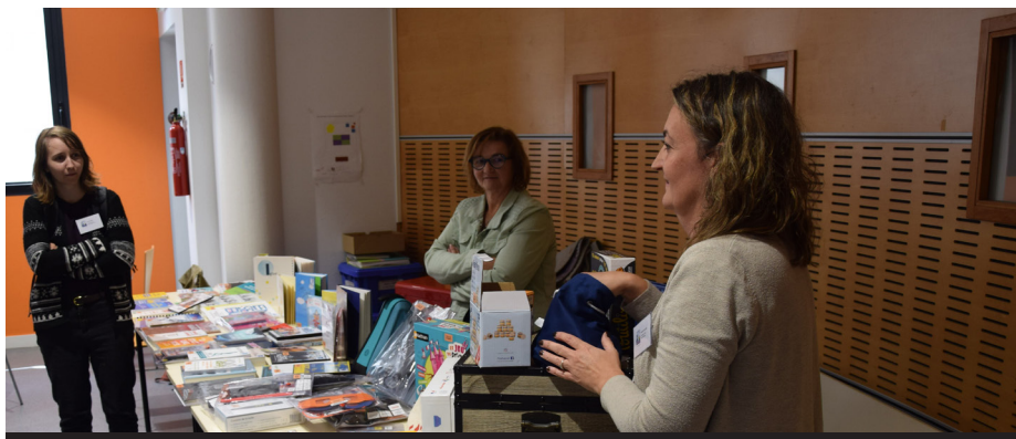
Le BiblioPôle développe des collections adaptées et propose des outils de médiation

• La médiation hors les murs , modération assurée par Edouard Lavaud avec les interventions d'Aurélie Dernoncourt, bibliothécaire à Saint-Barthélemy-d'Anjou qui a