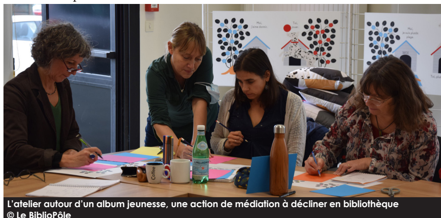
L'atelier autour d'un album jeunesse, une action de médiation à décliner en bibliothèque

L'année 2023 marquera le lancement d'une offre de formation autour de la lecture et du tout-petit et d'actions de médiation en lien avec Pas pareil , avec la venue à nouveau de l'autrice.