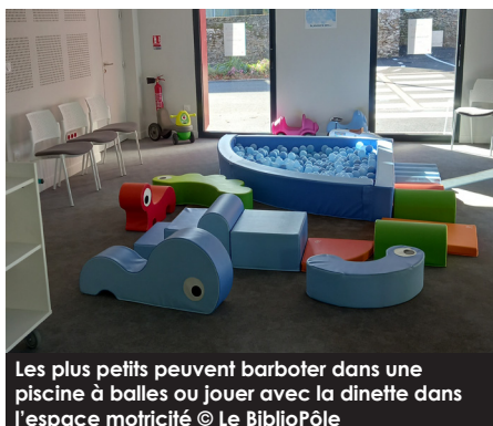
Les plus petits peuvent barboter dans une piscine à balles ou jouer avec la dinette dans l'espace motricité

C'est là toute l'originalité du lieu : la synergie totale avec l'espace ludothèque. Les jeux sont pleinement