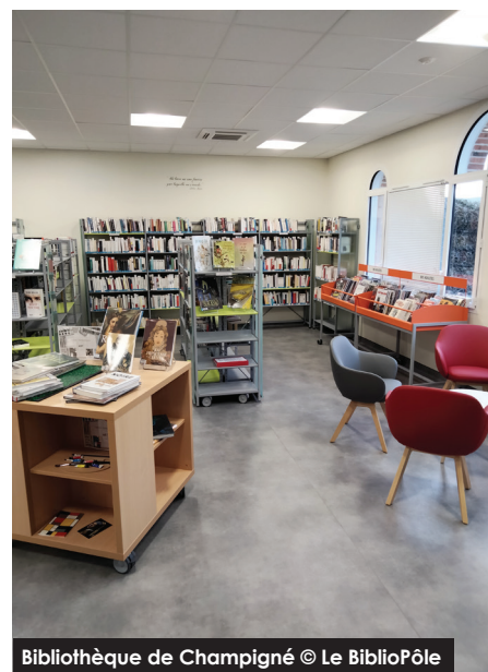
Bibliothèque de Champigné

De nombreuses actions qui démontrent bien le dynamisme de cette bibliothèque portée par son équipe, et la volonté d'en faire un lieu très accueillant, ouvert à tous et pour tous.