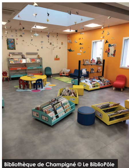
Bibliothèque de Champigné

Les bibliothèques du réseau des Vallées du Haut-Anjou continuent de se moderniser. En 2021, c'est Champigné (commune déléguée des Hauts-d'Anjou) qui en bénéficie.