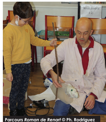
Parcours Roman de Renart

Si cette action est un peu chronophage et impose un rythme de travail soutenu, elle donne à la bibliothèque une belle visibilité !