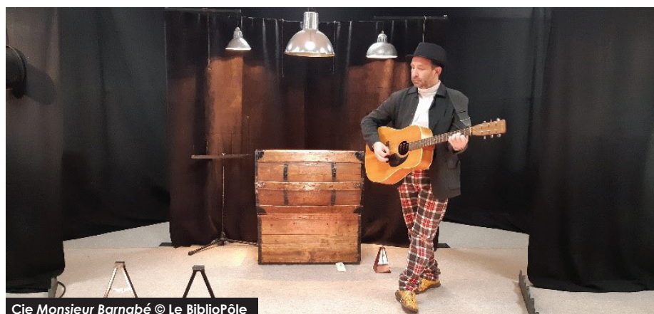
Cie Monsieur Barnabé © Le BiblioPôle

Pour tous renseignements : c.coinet@maine-et-loire.fr